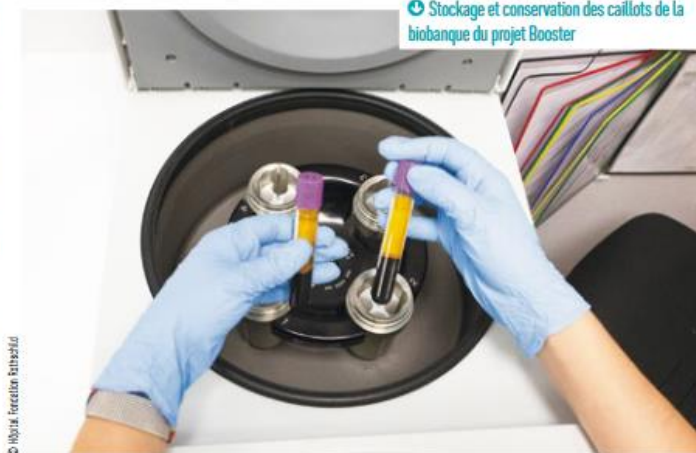
Stockage et conservation des caillots de la biobanque du projet Booster

Plus celle-ci est élevée, plus les traitements devront être puissants. Or, doser le traitement est primordial pour réduire le risque d'hémorragie cérébrale. Enfin, le projet porte également l'ambition de découvrir de nouvelles cibles thérapeutiques pour améliorer la thrombolyse et la