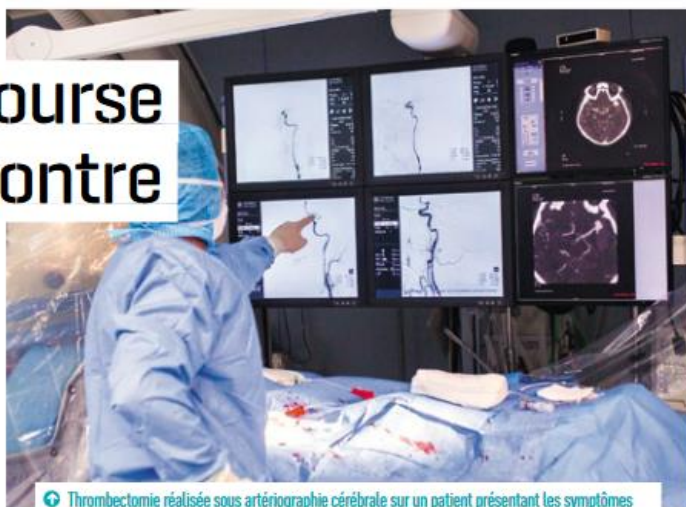
Thrombectomie réalisée sous artériographie cérébrale sur un patient présentant les symptômes d'un AVC à l'unité neurovasculaire du CHU de Bordeaux

Le caillot de sang, c'est le fil rouge du projet Booster, que dirige Mikaël Mazighi . Selon lui, chaque caillot possède une signature unique qui délivre de précieuses informations. En 2016, le chercheur et ses collaborateurs ont créé une biobanque de caillots, collectés auprès de patients victimes d'AVC. Jusqu'alors considérés