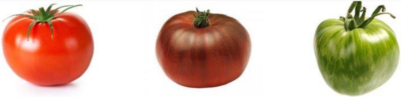
Photographie des 3 variétés de tomates étudiées : Tomate « commune » (gauche) ; tomate Noire de Crimée (milieu) ; tomate Green Zebra (droite)